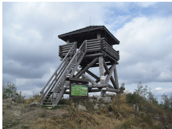
Rozhledna na vrcholu Knížecího stolce, foto Jana Zrnová

Další informace a fotografie k lokalitě naleznete zde . Simona Šafarčíková , Krajská síť environmentálních center Krasec, z. s.