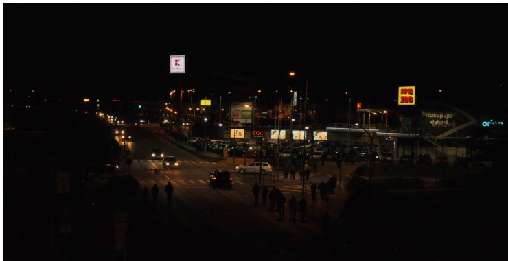
Hemžení u strakonického nákupního centra