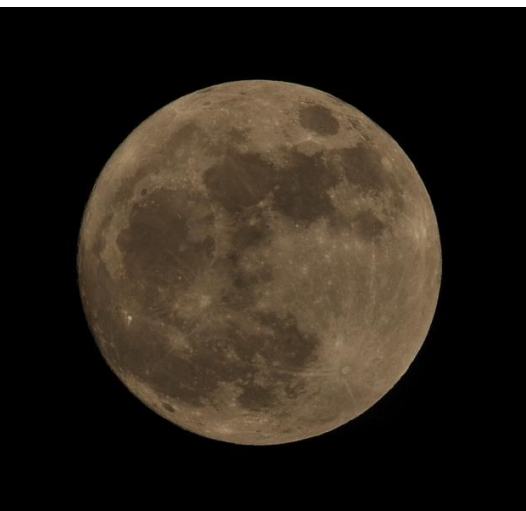
Měsíc 1. 1. 2018 v 18:43

Nový rok je na mnoha místech naší republiky, ale i v širém světě oslavován jako přelom od starého k novému. Pátrat po základech tohoto lidského zvyku by bylo asi pro historického laika obtížné a vesměs ovlivněné názory přejatými z knih a jiných zdrojů místo vlastní zkušenosti. A k tomuto časovému přelomu se váže i onen ohňostroj. Mimo jiné si tohoto děje všímají i fotografové a vyfocení kroutícího se a prskajícího světla na potmělé obloze je výzvou. Zkoušel jsem ohňostroj zachytit na čipu svého digitálu již vícekrát a poslední návod mého poskytovatele grafického foto editoru mě opět vyburcoval k tomu to zkusit znovu. A tak jsme se s mou manželkou vydali do strakonických ulic.