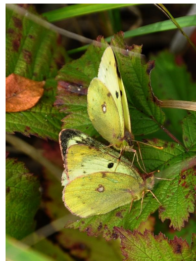
Žlutásek čičorečkový z lomečku

Vše je příjemně usazeno u nefrekventované silnice. Z hrany