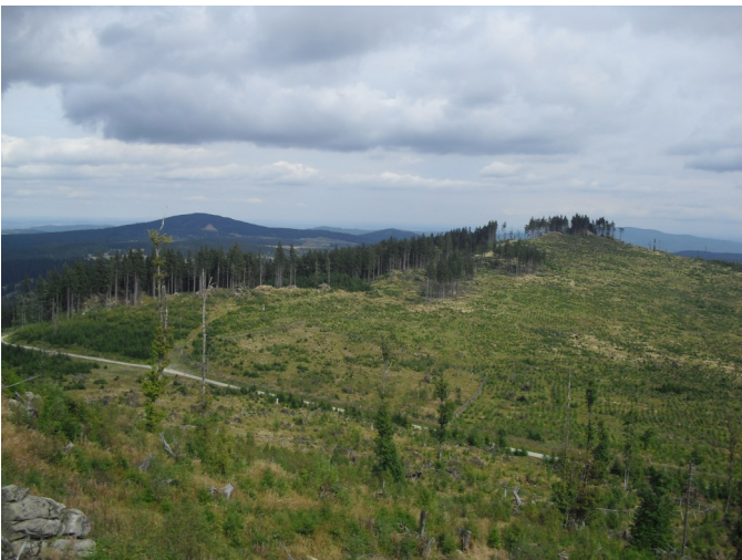
Výhled z rozhledny na Lysou (1 228 m n. m.) a Chlum (1 188 m n. m.), foto Jana Zrnová

Cesta na Knížecí stolec začíná na parkovišti v Uhlíkově a vede podél zarůstajících luk a pak převážně lesy. Bystří návštěvníci si mohou všimnout zbouraných domů podél cest z dob, kdy se budoval vojenský újezd, či kamenných mostků přes zdejší potoky. Ve vrcholové části Knížecího stolce