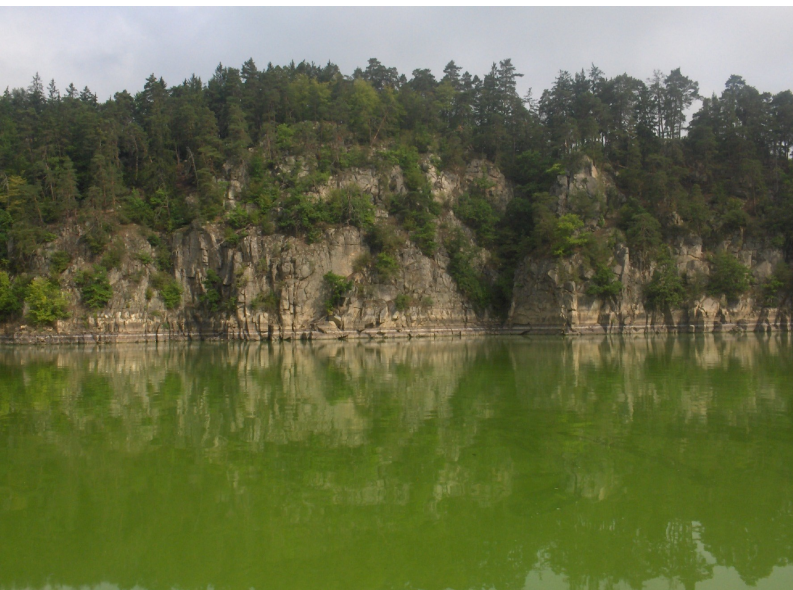
Vodní nádrž Orlík, léto 2007

Asi se víceméně shodneme na tom, že většina stávajících přehrad má své (i když různé) opodstatnění. Stranou nyní ponechávám specializovaná vodní díla (pro chlazení elektrárenských okruhů atd.). Jak je to s vodárenskými nádržemi? Velmi často je nacházíme v horských či podhorských oblastech, kde se kromě jiného ještě daří zachovávat dobrou kvalitu přítékajících