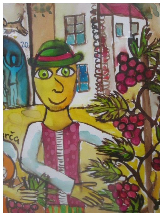
Ústy malovaný obr. Bára Sedláčková

Nebývám u toho, když se sejde u stolu velká společnost. Ochutnávání ve sklípku jsem ale zažila, a sice při celostátním srazu ČSOP v roce 2016 na Moravě. A musím říci, že vinař, který se nám věnoval, nás všech-