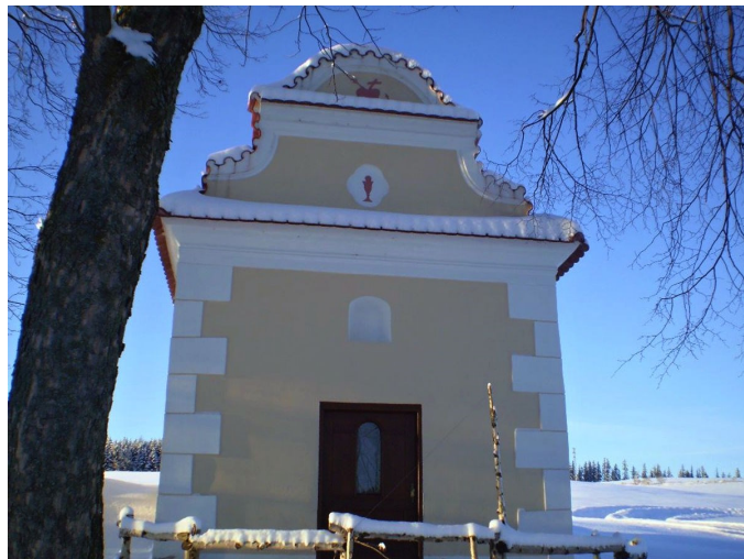
Kaplička na Michlově Hutí