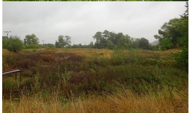
Rybníček Žebrák - září 2014 vs. září 2018