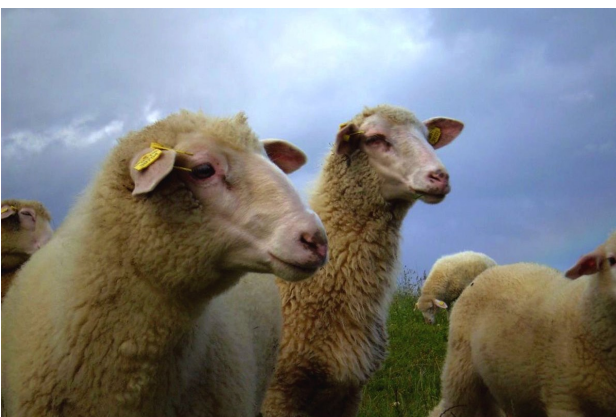
Chov šumavských ovcí, foto Iva Nováková

Rozcestník šetrné turistiky na webových stránkách www.enviroskop.cz a ve volně stažitelné mobilní aplikaci Enviroskop přináší tipy také na agroturistiku a seznamuje s lokální produkcí v Jihočeském kraji. Tentokrát vám představíme rodinnou ekofarmu Michlovka na samotě u šumavského lesa.