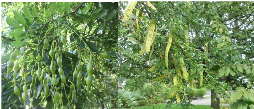
Plody jerlínu vs. dřezovce

Možná si ještě pamatujete na článek v Kompostu č. 11/2017 o rozdílu mezi jerlínem japonským a dřezovcem trojtrnným. Omlouvali jsme jím s panem Františkem Zimou tehdy chybu z předchozího čísla, na kterou jsme byli upozorněni. Jsme za zpětnou vazbu vždycky vděční a často k ní i vysloveně vyzýváme, protože sdílíme myšlenku, že víc hlav víc ví. A právě k tomu je náš časopis určen.