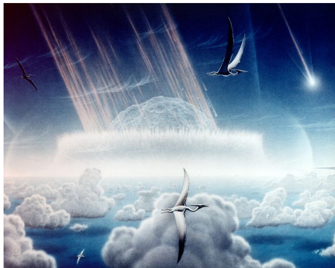
Autor Donald E. Davis, CCO