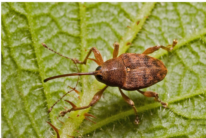
Nosatec žaludový