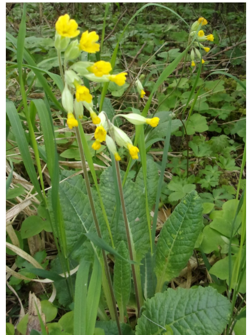
Prvosenka jarní, foto Alan Šturm

V současnosti v naší republice rostou pouze dva původní druhy "petrklíčů". Prvým z nich je prvosenka jarní ( Primula veris ), vytrvalá bylina dosahující včetně květenství výšky 20-25 cm. Vyskytuje se téměř v celé Evropě kromě jejích nejjižnějších a nejsevernějších oblastí, dále potom ještě v Malé Asii a na Kavkaze. U nás je sice místy dosud relativně hojná, ale přece jenom dochází - a to i jinde v Evropě - k jejímu úbytku. Hlavní příčinou tohoto negativního jevu je ničení biotopů lidskou činností, zejména intenzivním zemědělstvím (hnojení dusíkatými hnojivy, používání herbicidů, rozorávání travních porostů) a lesnictvím (holosečné kácení a vysazování jehličnatých monokultur). Prvosenka preferuje teplejší polohy v pásmu nížin a pahorkatin, půdy většinou na vápencovém podkladu; jejím biotopem jsou světlé listnaté a smíšené lesy, suťové lesy, háje, lesní lemy, křoviny a osluněné stráně. Prvosenky během zimy vždy ztrácejí staré listy a nové jim dorůstají v předjaří (únor až březen). Listy následně mohutnějí v průběhu vegetačního období, což je doba optimálních podmínek pro vývoj a růst, přičemž v případě prvosenek se jedná o týdny mezi dubnem až srpnem. Maximální velikosti jejich listy dosahují v létě, od září postupně stárnou. Za vhodných poměrů se v dané lokalitě přitom jednotlivé exempláře prvosenek mohou dožít více než padesáti let.