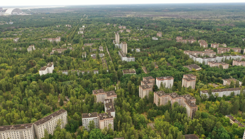
Pripjat

Turistickou oblíbenost černobylské zóny dokazují mnohá, veskrze amatérská videa a reportáže z exkurzí do oblasti. Nejpovedenější je podle mého názoru série videí projektu badatele.net (viz zde , zde , zde , zde a zde ), které bez patosu dokumentuje nejen současnou podobu oblasti, stav elektrárny, ale také průběh celé exkurze a profesionální práci a poutavý výklad jedné z českých průvodkyň. Stejný projekt uveřejnil i další zajímavé video, které hodnotí širší kontext událostí roku 1986 (viz zde ). Obsahuje i zkrácenou verzi raritní výpovědi jaderného inženýra Anatolije Ďatlova, který je v oficiální rovině označován za jednoho z hlavních viníků tragédie (samostatně zde ).