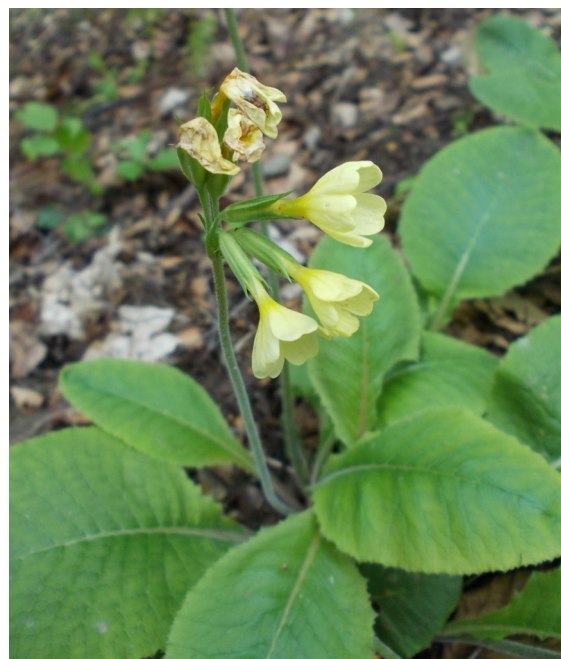
Prvosenka vyšší

Také prvosenka vyšší je vytrvalá bylina s přizemní růžicí listů a uzlovitým oddenkem, který je hustě obrostlý hnědými kořeny. Mladší listy jsou ze začátku na okrajích mírně podvinuté a na spodu šedozeleň zbarvené. Plně vzrostlé listy jsou pak celistvé a tvaru vejčitého nebo kopinatého, jejich řapíky jsou křídlaté a zubaté. Na konci vzpřímené lodyhy se nalézá jednostranný převislý okolík oboupohlavných a pravidelných pětičetných květů. Pětičetné jsou kalich i koruna. Kalich je bledě zelený, na hranách a zubech však trávově zelený. Koruna je delší než kalich, bleďožluté barvy a s o něco tmavšími středy. V každém květu se nacházejí pohlavní orgány - samičí pestík s prodlouženou čnělkou zakončenou hlavatou bliznou a pět samčích tyčinek přirostlých ke korunní trubce. Různočnělechost (heterostylie) květů se u tohoto druhu vyskytuje stejně jako v případě prvosenky jarní. Prvosenka vyšší kvete v březnu až květnu, po odkvětu se vytvoří plod - válcovitá tobolka o délce 11-15 mm s plochými semeny uvnitř.