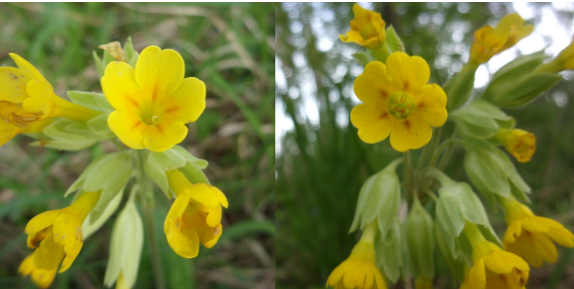
Prvosenka jarní, květ typu „L“ a „S“