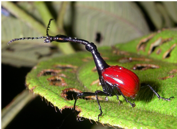
Nosatec žirafí

• Nosatcovití jsou nejen velkou, ale dokonce druhově nejpočetnější čeledí brouků. Je známo 83 000 popsaných druhů! Typická je pro ně kulatá hlava prodloužená v cosi, co se podobá nosu, ale nos to ve skutečnosti není. Je to orgán určený k vrtání děr do plodů, do nichž jsou pak ukládána vajíčka. Na konci „nosu“ (nosce) jsou totiž velmi výkonná kusadla. Jedním z nejpodivuhodnějších zástupců této čeledi je nosatec žirafí, žijící pouze na Madagaskaru. Vypadá opravdu jako nějaká hmyzí žirafa. Nebo jako oživlý miniaturní modýlek jeřábu s pohyblivým ramenem (viz krátké video zde ). Jeho prodloužený krk se v polovině láme v kloubu, díky němuž dokáže pohodlně sklonit hlavu až k předním končetinám. Krk neslouží k dosahování