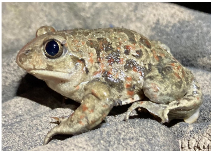
Blatnice skvrnitá

• Blatnice skvrnitá se může zdržovat i několik kilometrů od vody. Tu vyhledává krátce v době páření, jinak má ráda pole, zahrady, křovinaté porosty, městské parky... Můžete ji vykopat na brambořišti nebo se s ní potkat na venkově na dvoře... Tůň ke kladení vajíček se jí líbí, když mají zarostlé břehy, ale nutné to není. Jsou známé případy, že se pulci vyvinou i v nádrži bez vegetace.